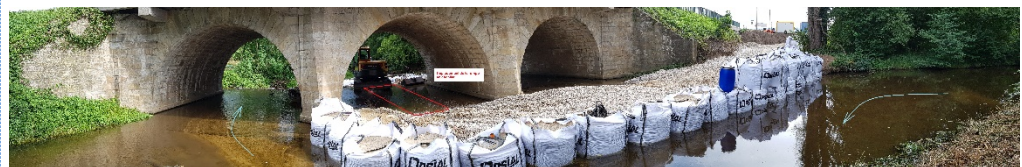
Etat de l'avancement actuel du chantier de RCE sur la rivière Bonson@LFa