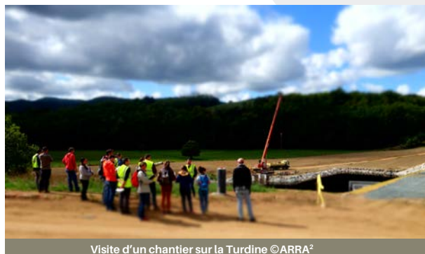
Visite d'un chantier sur la Turdine

Enfin, dans le cadre d'un projet conçu par un bureau d'étude prestataire, un suivi de chantier réalisé en interne nécessite une bonne appropriation du projet par le technicien de la collectivité.