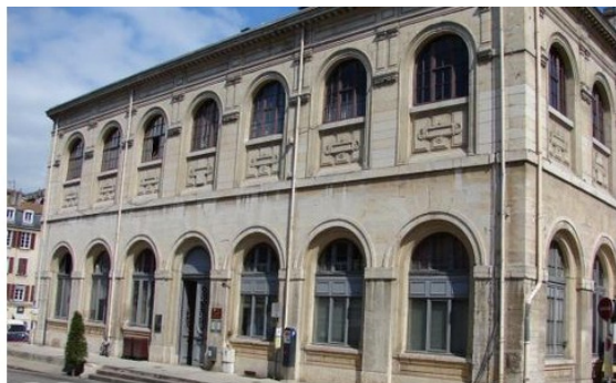
Salle des fêtes Place Miremont 38200 VIENNE