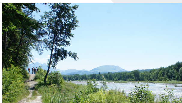
Le Drac restauré

La loi sur la Biodiversité de 2016 vient remettre en cause ce fonctionnement en incitant à recourir à la concertation et à la négociation, comme c'est le cas en droit privé.