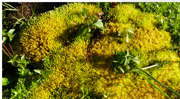
Matelas naturel

L'établissement d'une stratégie territoriale est d'autant plus nécessaire dans le nouveau contexte GEMAPI qui a redéfini les compétences en termes de gestion des zones humides.