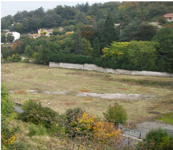
Le site avant travaux

Le contrat de rivière Furan et affluents prévoyait, en synergie avec la commune de Saint-Étienne, la découverte du Furet. Ce chantier s'est déroulé en plusieurs phases.