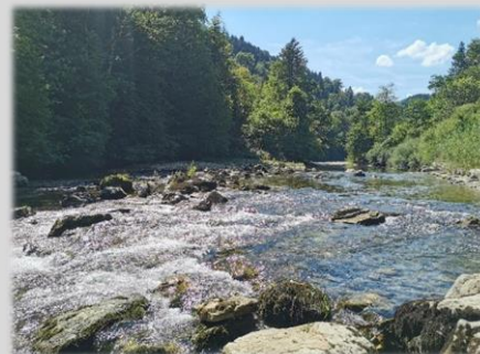
Ancien seuil de Fleurey