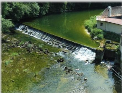
Seuil de la Voyéze