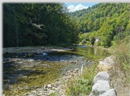
Ancien seuil de Neuf Gouffre