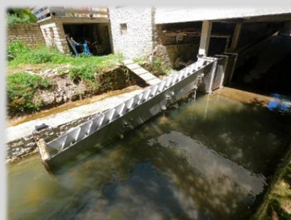
Passe à poissons Scierie des Noues