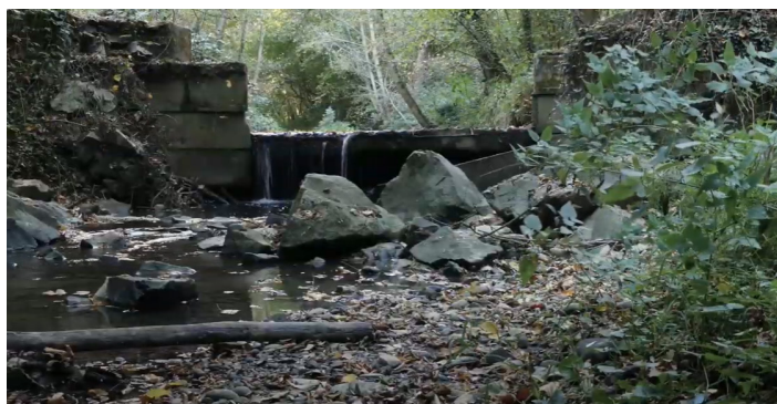
Seuil avant réalisation des travaux