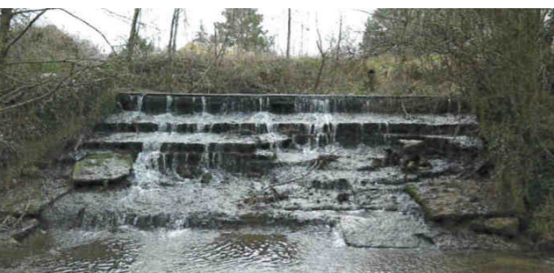
Seuil avant réalisation des travaux

Le seuil de la Torine est situé en aval du pont de la RD66c et se trouve sur la commune de Misérieux au niveau du lieu dit « La Torine ».