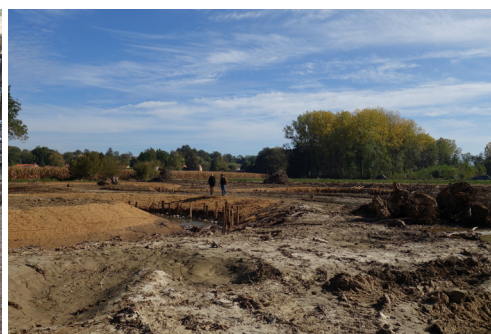
Site après travaux