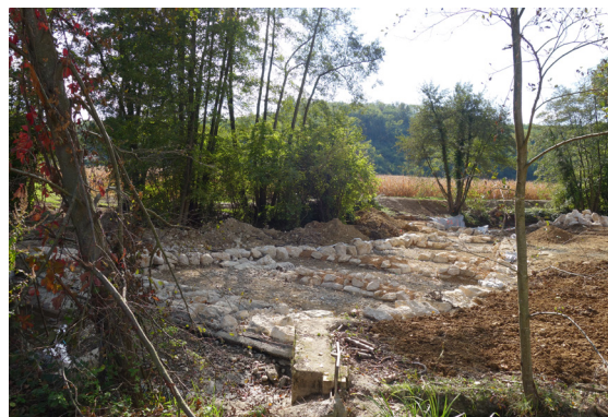
Passe à poisson en cours de travaux