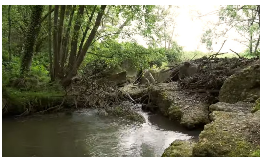
Aqueduc avant réalisation des travaux