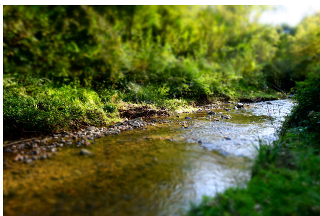
Site à l'automne 2021

Vidéo de présentation du projet : https://www.youtube.com/watch?v=yU9kAOqurIM&t=8s