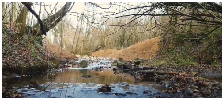
Site à l'hiver 2019-2020