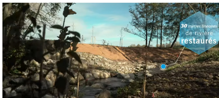
Site après travaux

Vidéo de présentation du projet : https://www.youtube.com/watch?v=vUrtJeGIbvU