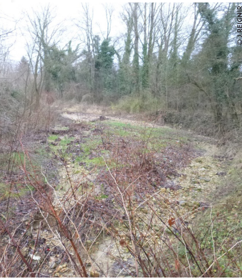
Bassin du piège à gravier