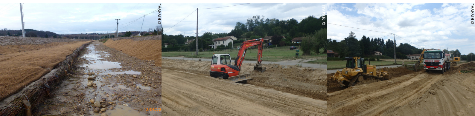
Photos des travaux

À la confluence avec ses affluents, des matelas gabions ont été placés pour dissiper l'énergie lors des épisodes de crues.