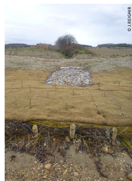
Matelas gabion à la confluence d'un affluent

Les prochaines crues vont permettre d'évaluer les effets des aménagements sur la réduction de l'exhaussement du lit et donc des inondations.