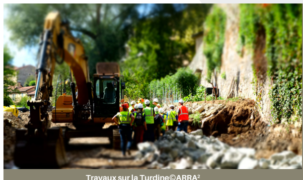
Travaux sur la Turdine©ARRA 2

Quelles sont les responsabilités des différentes parties prenantes pour les travaux en rivière ? Quelles différences et quelles spécificités de la responsabilité civile décennale et de la responsabilité civile générale ? Que se passe-t-il en cas de contentieux ?